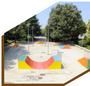
:: PARQUE RADICAL