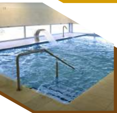
:: PISCINA TERMAL