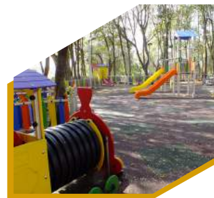
:: PARQUE INFANTIL PARQUE MUNICIPAL