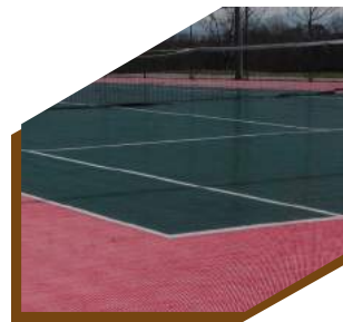
:: CAMPO DE TÊNIS