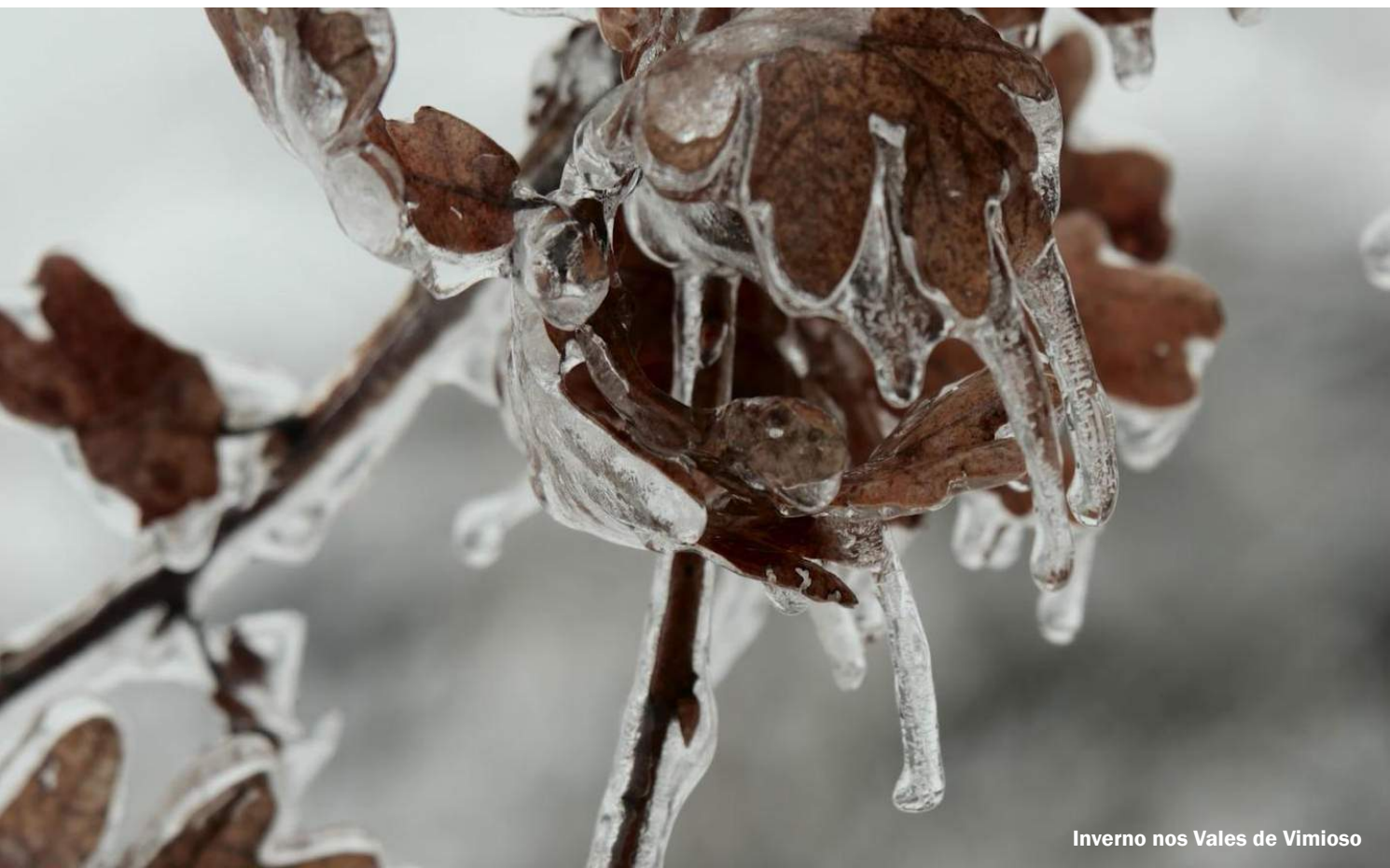
Inverno nos Vales de Vimioso