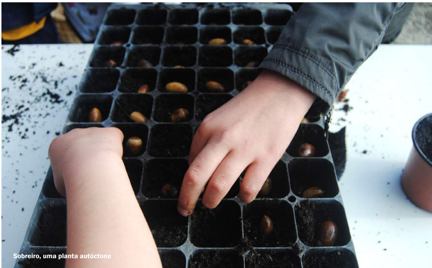
Sobreiro, uma planta autóctone