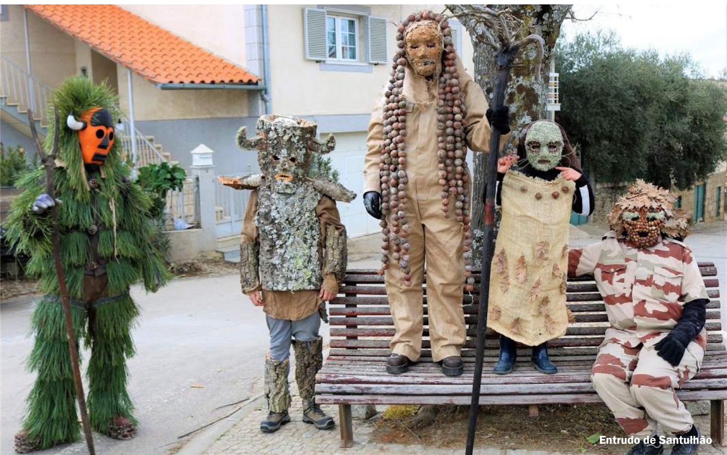
Entrudo de Santulhão